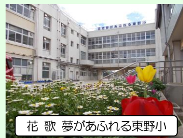
花 歌 夢があふれる東野小